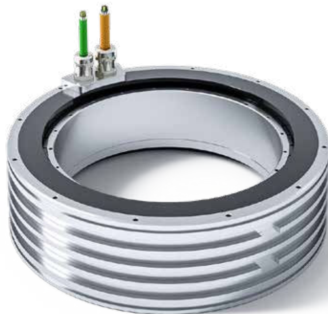
Motore rotativo QTL, la serie amplia la gamma di motori torque Tecnotion con diametro esterno fino a 485 mm.

in kit macchina con tutti i componenti necessari a creare moduli lineari o rotativi completi, consentono di soddisfare le esigenze di consegna ai clienti in tutto il mondo. Nel 2023 è inoltre previsto un ampliamento dei plant produttivi, con l'apertura di un secondo sito in Europa dell'est che affiancherà quello in Cina, tra la fine di quest'anno e inizio 2024.