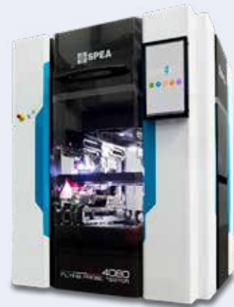
Il Flying Probe 4080 di Spea, macchinario di test per componenti microelettronici, monta motori direct drive Tecnotion forniti da Servotecnica.

spazi molto contenuti. Dal momento che la macchina misura valori di femtoampere, per ridurre il noise elettromagnetico attorno alle sonde i due motori ironcore sono inoltre stati sviluppati ad hoc per lavorare in bassa tensione e in modalità low emission, fornendo determinate caratteristiche di accelerazione e velocità. Il tutto nel rispetto dei limiti geometrici dovuti agli spazi contenuti della macchina. Servotecnica ha presentato anche un motore ancora più piccolo, non ancora a catalogo, che potrebbe essere interessante per altre future applicazioni.